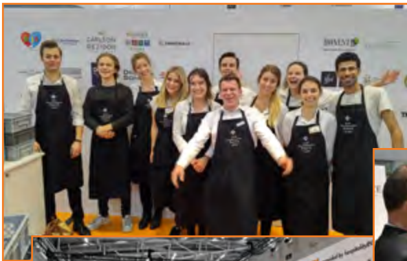
Die Aussteller vergaben auch 2019 Top-Noten an die Hosts und Hostessen.

Die Versorgung mit Getränken, Kaffee- und Tee-Spezialitäten sowie Fingerfood ist für Standpartner und deren Gäste in den Paketen eingeschlossen.