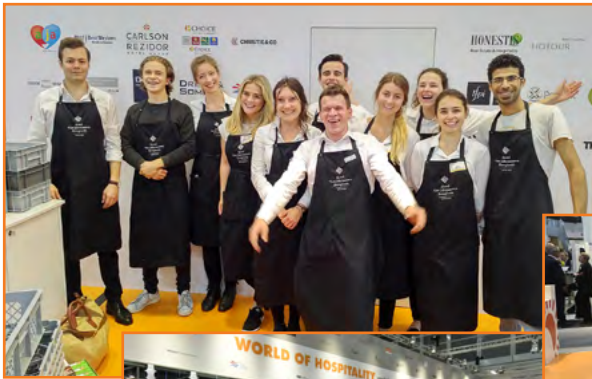
Die Aussteller vergaben auch 2018 Top-Noten an die Hosts und Hostessen.

Die Versorgung mit Getränken, Kaffee- und Tee-Spezialitäten sowie Fingerfood ist für Standpartner und deren Gäste in den Paketen eingeschlossen.