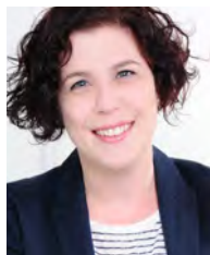
Malin Flamm Redaktion