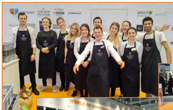
Die Aussteller vergaben auch 2018 Top-Noten an die Hosts und Hostessen.

Die Versorgung mit Getränken, Kaffee- und Tee-Spezialitäten sowie Fingerfood ist für Standpartner und deren Gäste in den Paketen eingeschlossen.