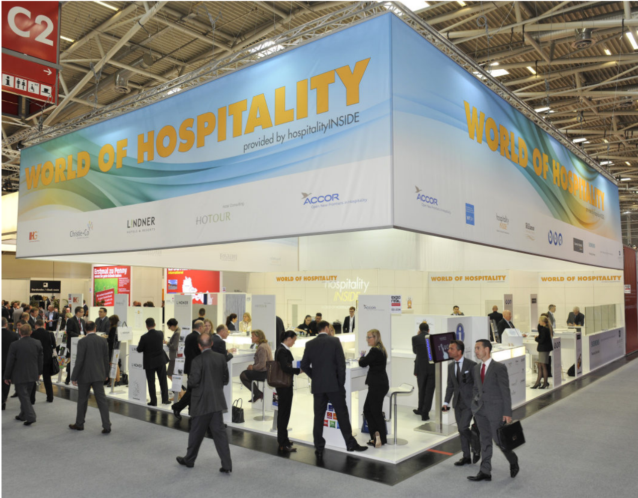
World of Hospitality

Die EXPO REAL bietet ein immer facettenreicheres Bild rund um die Hotelimmobilie - unterstützt von hospitalityInside.