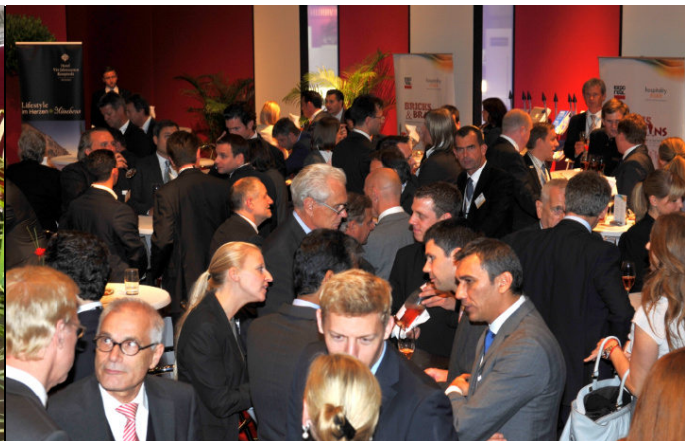
BRICKS & BRAINS